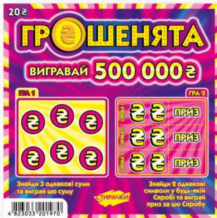
Макет лотерейного білета серії 21 державної лотереї «ГРОШЕНЯТА» (лицьова сторона)

Примітка: Фактичний розмір лотерейного білета може відрізнятися від розміру, наведеного у цьому макеті.